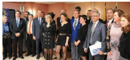
Magique ! Quel moment de bonheur !

11 nouveaux Lions à l'assistance (54 Lions présents - 13 clubs représentés) : qui a découvert ces 9 jeunes toniques et motivés (dont 6 jeunes femmes) et... 2 ex-Lions (tout aussi motivés) de retour dans la famille.