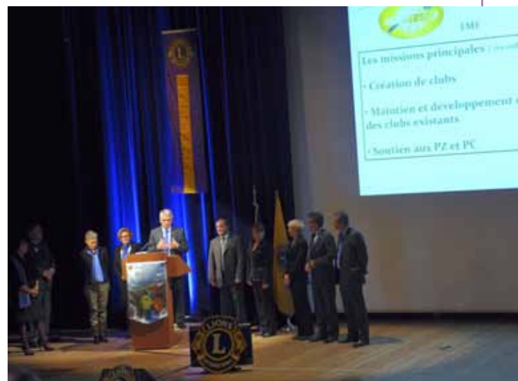
L'équipe EME lors du Congrès d'Automne.