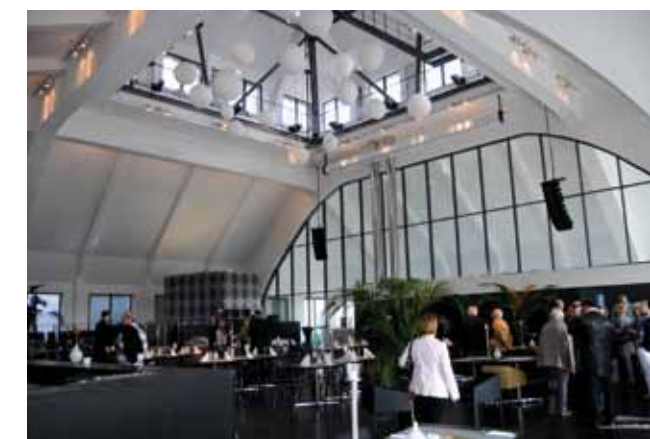
La salle de restaurant du "U Zentrum", cathédrale Baubaus de béton et d'acier.

Le déjeuner dans le dôme avec nos amis du jumelage permet d'admirer le panorama sur toute la région avoisinante. Exit les fumées et les usines, remplacées par les espaces et les activités «propres». Qu'elle est devenue belle ma verte vallée!