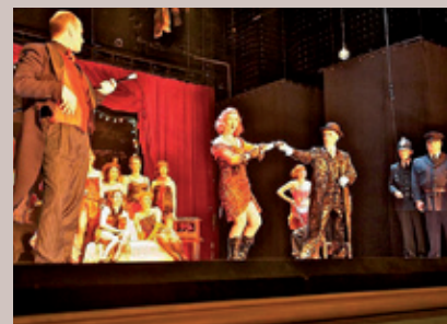
L'Opéra de Quat'Sous organisé par Versailles Doyen.

Dans notre précédent N° nous avons « attribué » la soirée Opéra de Quat' Sous à Versailles Trianon ! Nos lecteurs auront rectifié. C'est bien le club Versailles Doyen qui a organisé cette belle soirée.