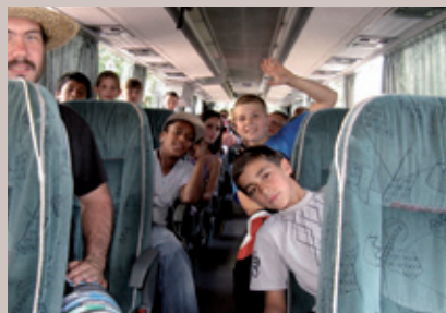
C'est 7 enfants que le Club Versailles Doyen aura envoyé en vacances avec Vacances Plein Air.

Pour sa part, le Lions Club Versailles Doyen a envoyé cette année cinq enfants à Olonnes sur Mer, en Vendée et deux enfants à Remiremont dans les Vosges... prêts à repartir l'année prochaine pour de nouvelles aventures.