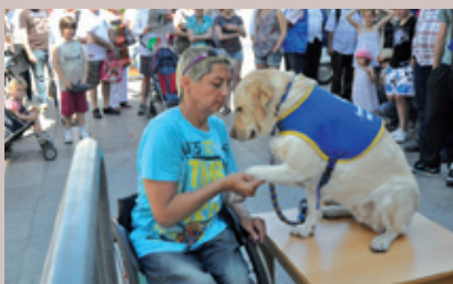
Le Club de Rueil soutient l'achat de chiens d'assistance pour les personnes handicapées.

Rendez-vous l'année prochaine pour la 22 ème édition !